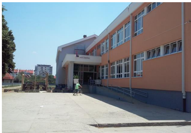
ОШ „Трајко Стаменковић“ у Лесковцу