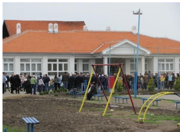
ОШ „Трајко Стаменковић“ у Г. Стопању

Основна школа "Трајко Стаменковић" у Лесковцу саграђена је 1984. г. када је и почела са радом. Састоји из две ламеле укупне површине 2 721, 76 м 2 . Ламела А саграђена је 1984. године, а ламела Б 1987. године. Површина школског дворишта са зградом је 134 ара. У саставу школе је четвороразредно издвојено одељење у Горњем Стопању од 420м 2 , саграђено је 2012. г.