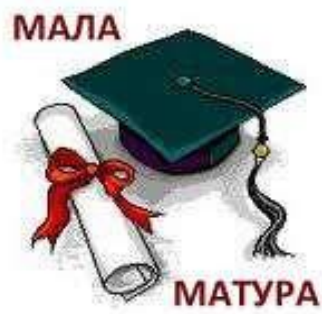
28. јун 2021. Подела ђачких књижица и сведочанстава