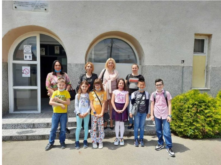
23,24,25. јун 2021. Полагање пријемног испита