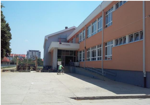
ОШ „Трајко Стаменковић“ у Лесковцу