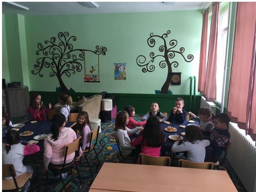
Кренуо са радом продужени боравак