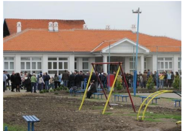
ОШ „Трајко Стаменковић“ у Г. Стопању

Основна школа "Трајко Стаменковић" у Лесковцу саграђена је 1984. г. када је и почела са радом. Састоји из две ламеле укупне површине 2 721, 76 м 2 . Ламела А саграђена је 1984. године, а ламела Б 1987. године. Површина школског дворишта са зградом је 134 ара. У саставу школе је четвороразредно издвојено одељење у Горњем Стопању од 420м 2 , саграђено је 2012. г.